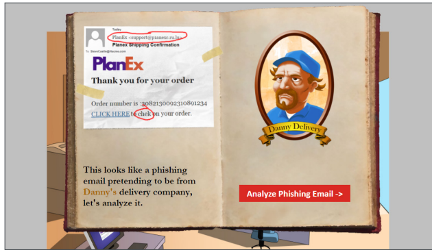
Una selezione di moduli di formazione interattivi, per coinvolgere gli utenti

I più di 60 moduli di formazione interattivi educano gli utenti, preparandoli a rispondere a minacce specifiche, quali ad esempio e-mail sospette, furto di credenziali, livello di sicurezza della password e conformità alle normative in vigore. I moduli sono disponibili in 10 lingue diverse e gli utenti finali li troveranno utili e interessanti; nel frattempo voi potrete godere della massima tranquillità, sapendo che i dipendenti sono pronti ad affrontare i veri attacchi futuri: